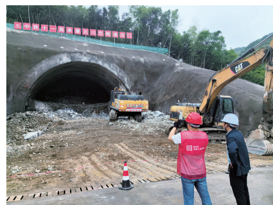
人保财险舟山市分公司勘查隧道施工现场,详细查验台风预防和施工安全防范措施。