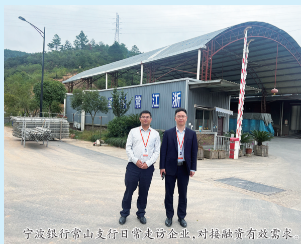
宁波银行常山支行客户经理走访企业,对接融资需求。