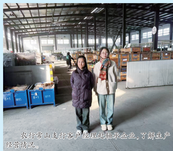
农行常山支行客户经理赴轴承企业,了解生产经营情况。