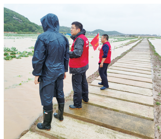
人保财险舟山市分公司工作人员冒雨对受灾农户进行查勘。