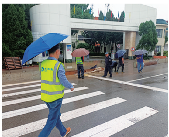
太保财险舟山中心支公司协助金鹰集团开展内涝预防。

金鹰公司为历年台风季重点排查企业,查勘小组根据临灾走访查勘结果,向负责人指出各隐患点,沟通提供整改方案,并协助客户及时安装加固挡水墙和挡水板,落实防止山洪来袭的挡水措施,有效阻挡了上午的一波洪峰,化解厂区内内部积水风险。太保财险舟山中心支公司的有效防灾服务赢得