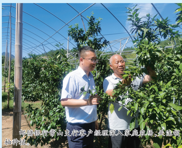
邮储银行常山支行客户经理深入农户家中,为农户提供金融服务。