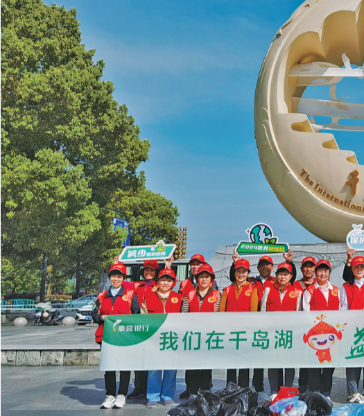
台州银行员工在千岛湖进行环保活动,倡导绿色出行和低碳生活。