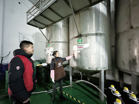
衢州银行客户经理实地走访常山斯帝油茶开发有限公司,提供金融支持。

浙江龙顶茶叶集团有限公司是开化县茶行业领军企业,深耕龙顶茶产业20余年,始终以提升“开化龙顶”品牌影响力、引领区域茶产业高质量发展为己任。通过依托两山集团投资的365共富联盟开化龙顶“三茶融合”创新园,浙江龙顶茶叶集团有限公司以“花鸟间”品牌为核心,确立品牌架构与建设计划,通过传统销售、直营店体验及线上直播联