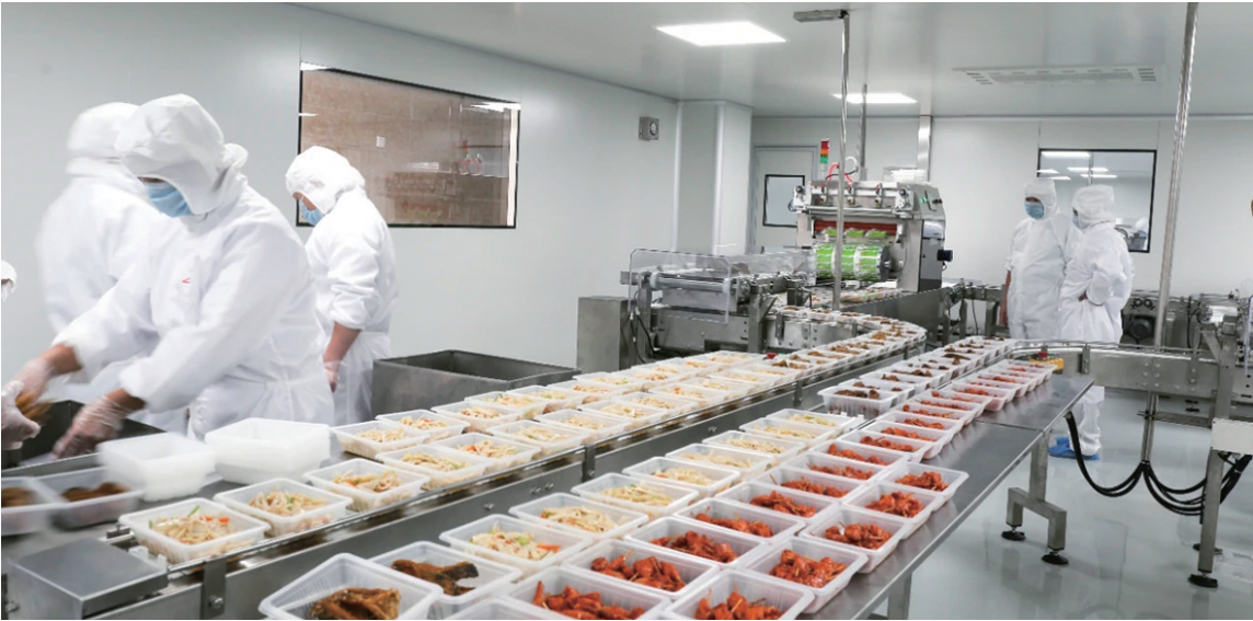
“不老神”整洁明亮的生产车间。