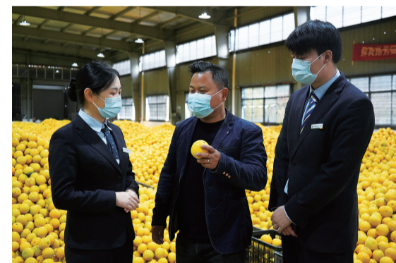
邮储银行常山县支行走访众胡柚专业合作社,了解企业生产销售情况。

其中之一,自2018年常山邮政将其作为农产品基地起,邮银双方充分发挥资金流、信息流、实物流“三流合一”的服务优势,累计为其发放惠农贷款共计539万元,利用渠道平台资源帮助其进行线上线下销售金额达2000余万元,同时提供收寄前置服务实现果园直发,累计寄递200万公斤。