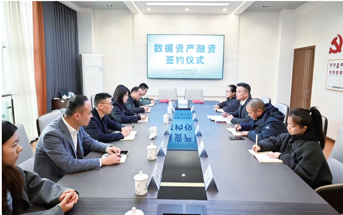
衢州银行衢州开化支行与开化县水务有限公司进行数据资产融资签约。

衢州金融监管分局加强组织领导,及时传达国家关于金融支持实体经济的最新政策,梳理分析区域金融服务现状,要求金融机构进一步深化金融服务,完善金融服务体系。在衢州,这样的例子还有很多,如浙商银行衢州江山支行创新推出行内首单中型企业续贷业务,这不仅是金融支持实体经济的一个缩影,