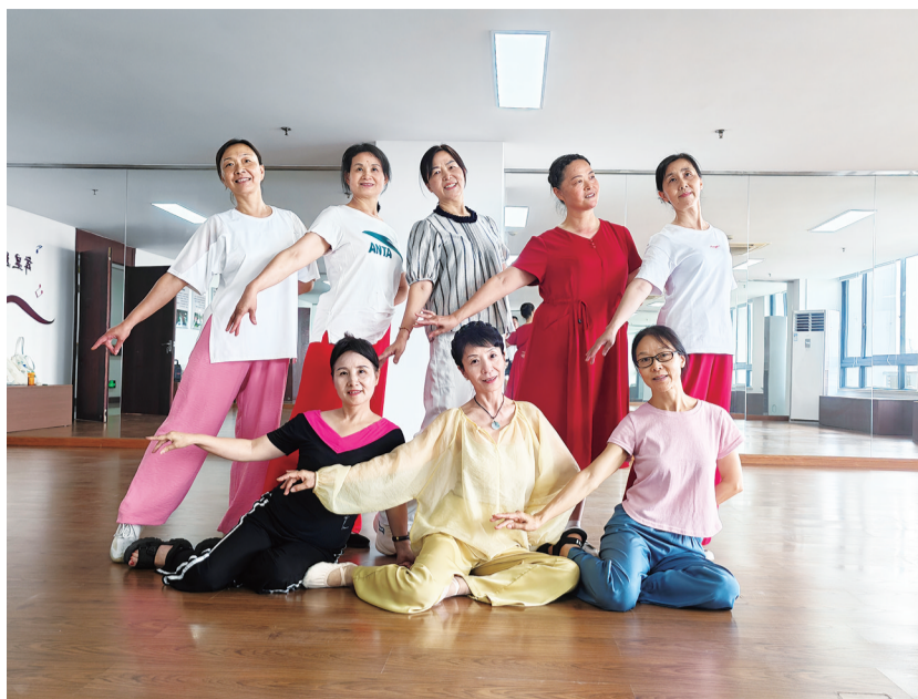
“德润银色家园”暨老年大学金融分校开展健身舞蹈班活动。

“您身体还好吗?生活上有什么困难尽管和我们说。”走访中,绍兴银行湖州分行党支部书记与老党员