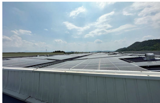
安吉亚太制动公司分布式光伏发电设备

支行向久大家具授信绿色普惠贷370万元，根据其ESG评价等级给予相应利率优惠，节约企业融资成本50个BP。