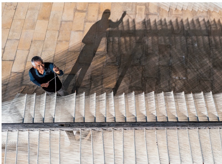
瑞安市高楼镇南山村的索面有300多年的历史。建行温州瑞安支行依据地域行业特点、经营现状等，一户一策“量体裁衣”，为手工做面农户创新融资服务。

行三级联动，通过相关拆迁补偿政策的研究，多轮实地调研查看，最终结合农户的实际需求和乡村发展的长远规划确定了安置房贷款服务方案——由村集体提供阶段性担保、后续追加安置房抵押的方式，既能在短期内缓解缴存建房资金的压力，又能保障项目顺利完工。在“摸着石头过河”后，建行建立起完善的服务体系——“美丽乡村贷”保全措施可采取信用、担保、抵押、质押等一种或多种组合方式。