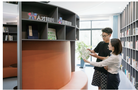
“安吉农商行作为余村全球合伙人”推介“丰收青创贷”

配件企业，为降低能源消耗和碳排放，工行安吉支行为企业提供节能改造贷款支持，利用闲置厂房屋顶安装太阳能分布式光伏设备，不仅可为企业和电网供电，实现年均发电2105万千瓦时，每年还可节约标煤约6410吨。