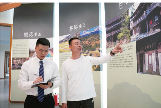
温州工行“共富专员”走访了解乡村文化历史。

计”。在洞头这座海岛，不少百姓以出海捕鱼、海产品加工和民宿、餐饮等行业为生。为了更好地金融支持农户创业，工行洞头支行不断下沉服务中心，扎实推进整村授信工作落地见效。