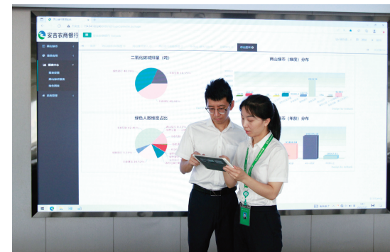
安吉农商行“两山绿币”系统数据汇总

安吉金融监管支局在湖州金融监管分局的指导下，将持续推动绿色普惠金融融合发展，完善绿色普惠金融标准体系，建立绿色普惠金融激励机制，支持绿色普惠金融试点和创新，做好做优绿色金融和普惠金融两篇大文章，助推实体经济可持续发展。