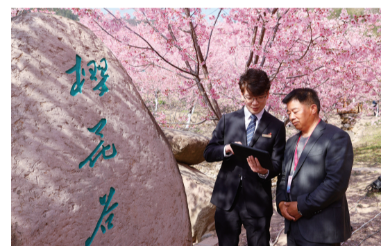
永嘉农商银行温州樱花园提供信贷支持，图为该行“共富专员”实地走访温州樱花园。

社会治理的基础在基层，薄弱环节在乡村。全面融入社会治理是农商银行坚守社区性地方金融机构定位、实现高质量发展的内在要求。2022年，立足农村“三资”智慧监管系统的成功经验，永嘉农商银行再次联合县纪委、县公共资源交易中心共同打造永嘉县限额工程智慧监管系统，有效破解村级项目施工中降额发包、暗箱发包、围包串包、履约不力等问题，为基层限额工程装上了“云探头”。目前，该系统已成功对3571宗项目实施云监测，累计监控金额达16.15亿元。