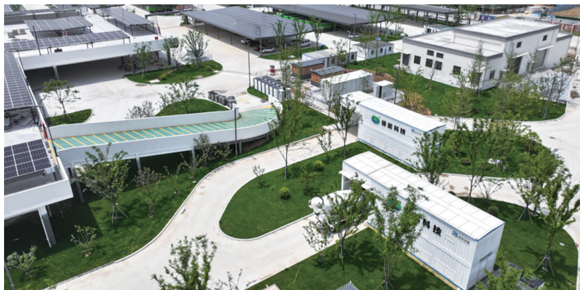
全国最大的光伏储能充换电一体站现场图

安吉久大家具有限公司是一家专注于电竞椅的研发、制造和销售的企业，生产的座椅产品符合2020《绿色产品认证实施规格家具》要求，获得中国绿色产品认证证书。在了解到企业融资需求后，农行安吉县