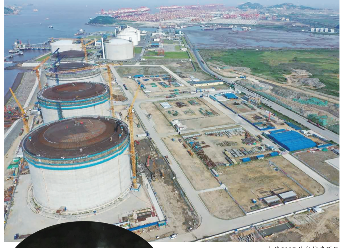
上海LNG站线扩建项目

舟山是我国第一个以群岛建制的地级市。近年来,海洋强国、“一带一路”长江经济带、长三角一体化发展、国家新区级、自贸试验区、江海联运服务中心等一系列重大战略在舟山叠加,给舟山带来机遇和挑战。一个个重大项目的建成落地离不开资金支持。今年以来,浙江金融监管局印发《关于金融高质量服务经济社会高质量发展的实施意见》《关于转发银行业保险业做好金融“五篇文章”指导意见的通知》等文件,要求辖内银行保险机构围绕“五篇文章”,以进促稳支持经济高质量发展,同时把“强化金融保障扩大有效益投资”作为应聚焦的五项重点工作之一。辖内机构积极响应政策号召,主动对接项目融资需求,开辟行内绿色通道,为重大项目建设保驾护航。 通讯员 俞靖捷 本报记者 赵琦