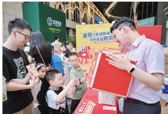
温州金融教育进瓯海万象城商圈开展“反诈市集”,受到市民欢迎。

今年以来,温州金融机构深入开展“五进”活动:进农村,打通金融孤岛“跨海桥”,开展消保宣教海岛行活动,建立离岛金融服务志愿队,全辖开展“金融讲堂”进乡村;进社区,筑牢金融风险“防火墙”,宣教进老干部(老年)活动中心、养老院、车船站候车中心,在居民小区设置宣教专区;进校园,撑起金融安全“保护伞”,前往中小学、高中、大专等院校开展多种形式宣教;进企业,送上金融服务“零距离”,进传统产业作坊、小微企业园区、建筑工地,送知识、送服务、送政策;进商圈,共建金融环境“舒适圈”,部门联动进市