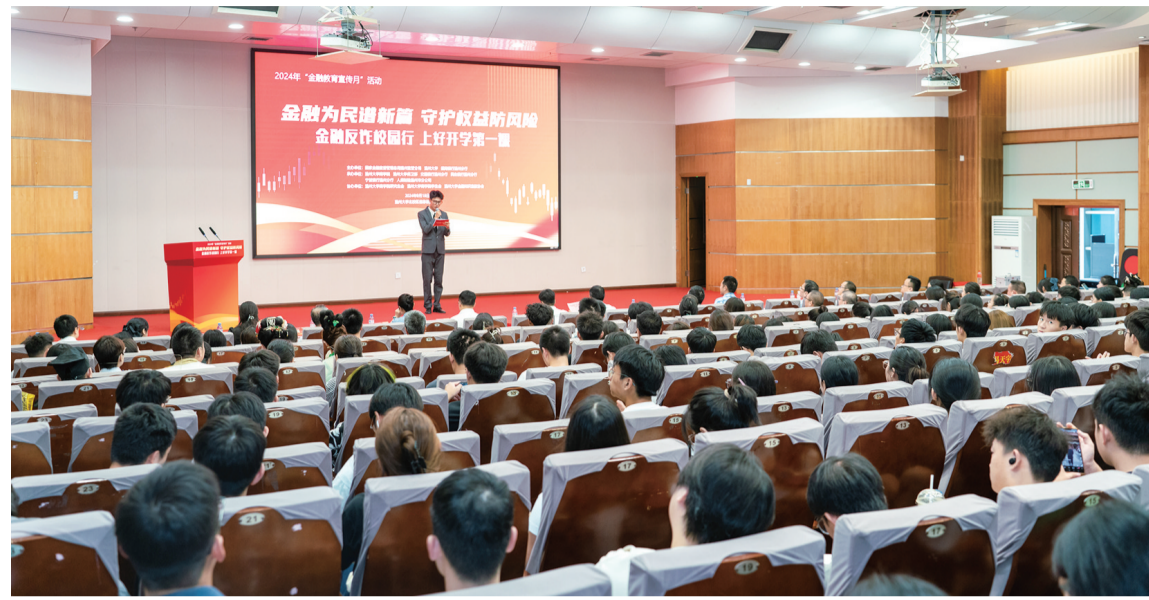
9月18日,温州金融教育宣传月“进校园”活动在温州大学举行,由温州金融监管分局牵头,温州大学商学院及招商银行温州分行等7家金融机构联合开展。