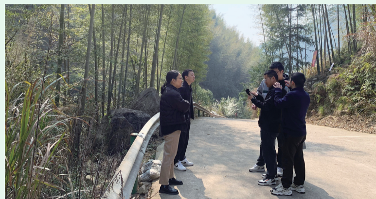
农发行衢州市分行直管业务部负责人与项目业主一同赴项目现场评估考察