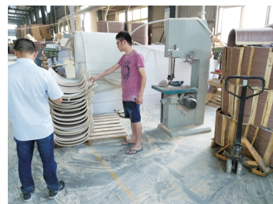
太保财险安吉支公司现场走访以竹代塑常规塑料制品制造车间。

下一步,安吉金融监管支局将奋力做好绿色金融大文章,持续推动辖内银行业保险业深化“以竹代塑”金融服务,优化金融资源配置功能,加强信贷、保险产品创新,进一步推进绿色金融发展,促进经济绿色低碳转型。