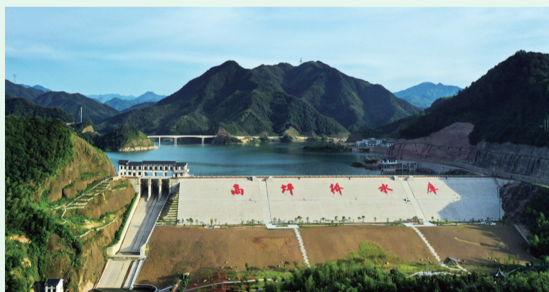
农业银行衢州分行金融支持龙游高坪桥水库建设