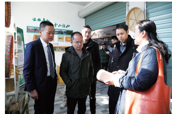
安吉三里亭农贸市场“以竹代塑”市场创建验收。