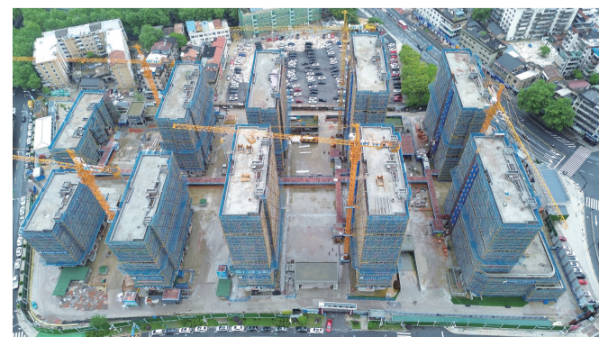
江山市通禄门未来社区一啤酒厂地块建设工程房屋结顶

截至目前,邮储银行衢州市分行已累计为该项目投放了4.95亿元的贷款,为项目的稳步推进提供了强有力的资金保障。该行展现出的专业、高效的综合金融服务能力,也赢得了政府及社会各界的广泛好评与高度认可。