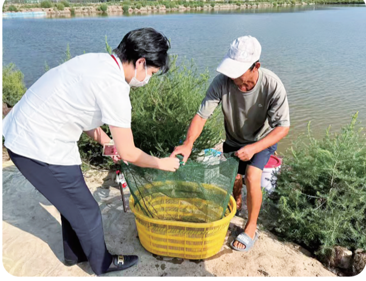
稠州银行客户经理调研渔民养殖情况。

共同富裕,潜力在农村。下一步,稠州银行将牢记金融为民使命,聚焦美丽乡村、产业兴旺、农民增收等领域服务国家乡村振兴战略,用更优质的金融服务守护耕耘者丰收硕果,以金融“活水”灌溉乡村沃土。