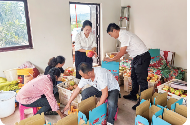
果园丰收手,稠州银行争分夺秒帮果农打包发货。