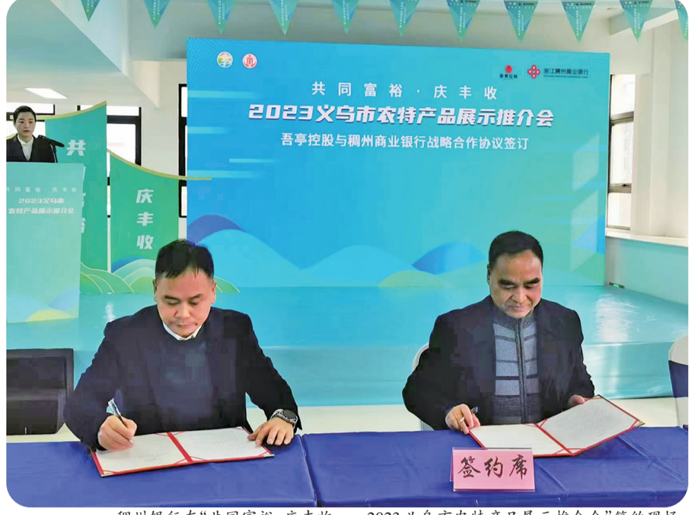
稠州银行在“共同富裕·庆丰收——2023义乌市农特产品展示推介会”签约现场。

在徐丰农业公司,浙江岱山稠州村镇银行客户经理走访得知,公司前期养猪场基建投入将近1亿元,但是商品猪出栏尚需时日,现在还差购母猪与饲料的资金。而在徐丰农业公司养猪场投产并实现全面运转后,岱山县生猪自给率将提升在50%以上。为有力保障养殖户的“菜篮子”,浙江岱山稠州村镇银行上门为其办理了贷款300万元,帮其化解短期资金需求。让村民足不出户就能享受高质量普惠金融服务,让每一个怀揣