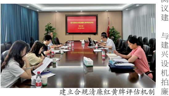
建立合规清廉红黄牌评估机制