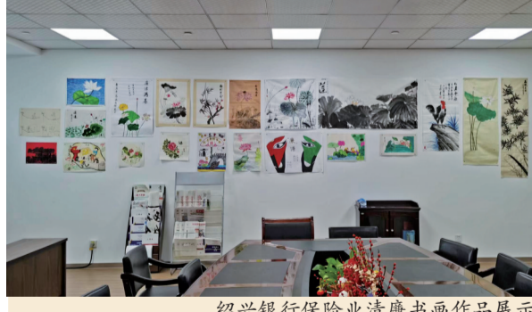
绍兴银行保险业清廉书画作品展示