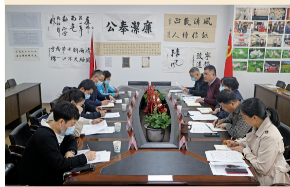
合规清廉金融文化建设专委会形成合力