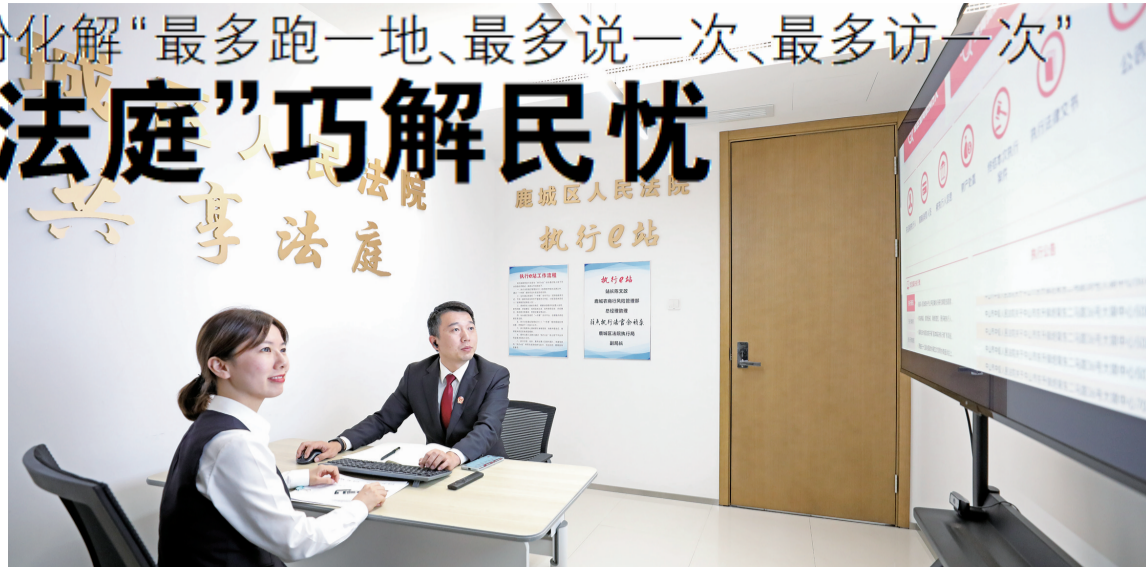
温州市鹿城区人民法院执行法官在“共享法庭”执行e站与站长对接工作。金仲章 摄

在鹿城农商银行,除了“共享法庭”,还有一块牌子是“执行e站”。原来,为疏通查人找物难、联动渠道不畅、案多人少等制约法院执行工作的难点痛点,2021年11月,鹿城农商银行加强与鹿城法院合作,在行内挂牌