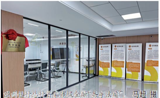
温州银行总行首家市级金融“共享法庭”。

金融“共享法庭”是温州市中级人民法院、温州银保监局推进“我为群众办实事”专题实践的重要举措,也是践行新时代“枫桥经验”的创新尝试。相较传统线下调解模式,“共享法庭”突破时空限制,将司法服务功能延伸至金融机构网点一线,有效推动金融矛盾纠纷就地化解、源头化解、实质化解,打通便民服务