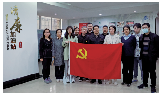
绍兴打造“越合规、越清廉”清廉金融文化品牌

潮平两岸阔,风正一帆悬。绍兴银行业保险业将继续深化合规清廉金融文化建设,全力营造风清气正、厚植稳健的金融生态,助力清廉绍兴建设,以清风正气强根基、促发展、惠民生,以践行“两个维护”的实际行动迎接党的二十大胜利召开!