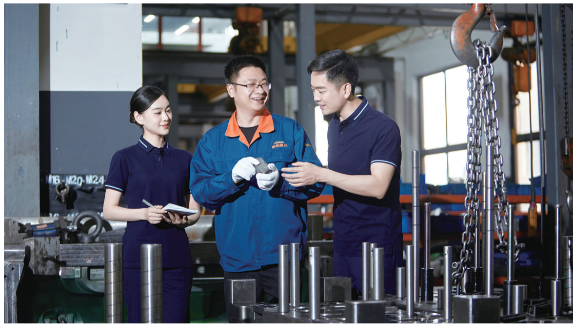
图为台州银行客户经理走访小微企业

针对评估难评估贵，人民银行台州市中心支行引导银行业对200万元以内小额贷款，根据商标旗下产品未来若干年收入现值初步估算价值，与贷款