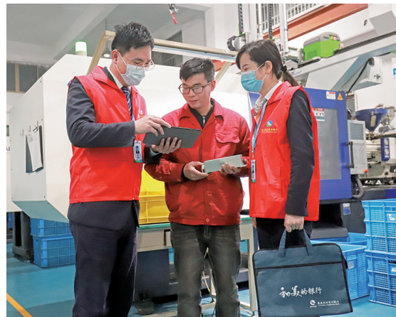
慈溪农商银行金融服务送上门

今年以来,宁波银保监局引领全市银行业保险业发挥金融要素在稳链纾困助企中的保障支撑作用,取得明显成效。该局先后印发《关于做好中小企业纾困帮扶激发市场主体活力的意见》等“1+N”个支持意见,指导金融业从市场主体特别是中小微企业实际困难出发,围绕“抗疫情、稳预期、疏堵点、保重点、降成本”五方面工作主线,千方百计保市场主体、保基本就业、稳产业链供应链。