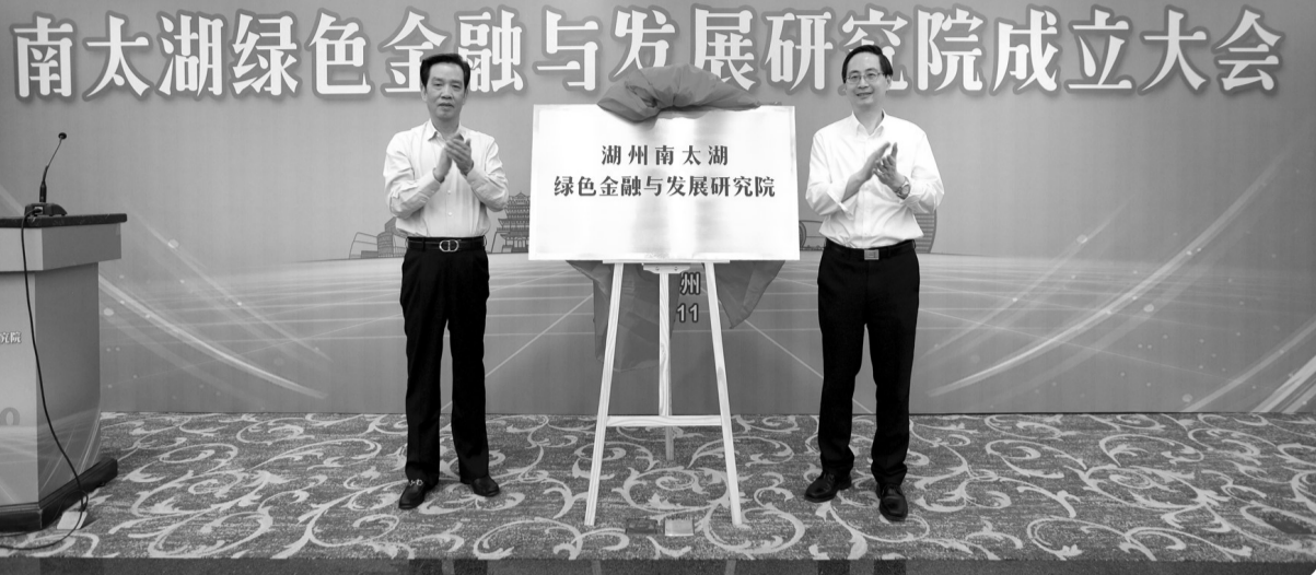
2019年5月11日,湖州南太湖绿色金融与发展研究院正式揭牌成立

记者了解到,当前,湖州绿色金融发展的核心工作之一就是要构建全国统一、清晰、可执行的绿色金融标准体系。湖州将继续深入实施绿色金融标准体系建设三年行动计划,加快绿色认定、评价、统计等标准建设,在绿色金融发展指数、赤道原则地方银行标准、中小银行环境信息披露标准、农商行绿色普惠信贷规范、环境污染责任保险产品等方面开展标准化建设,推动“美丽乡村贷”“无还本续贷”等金融产品标准化,努力形成既有地方特色,又有可复制、可借鉴价值的绿色金融标准体系。