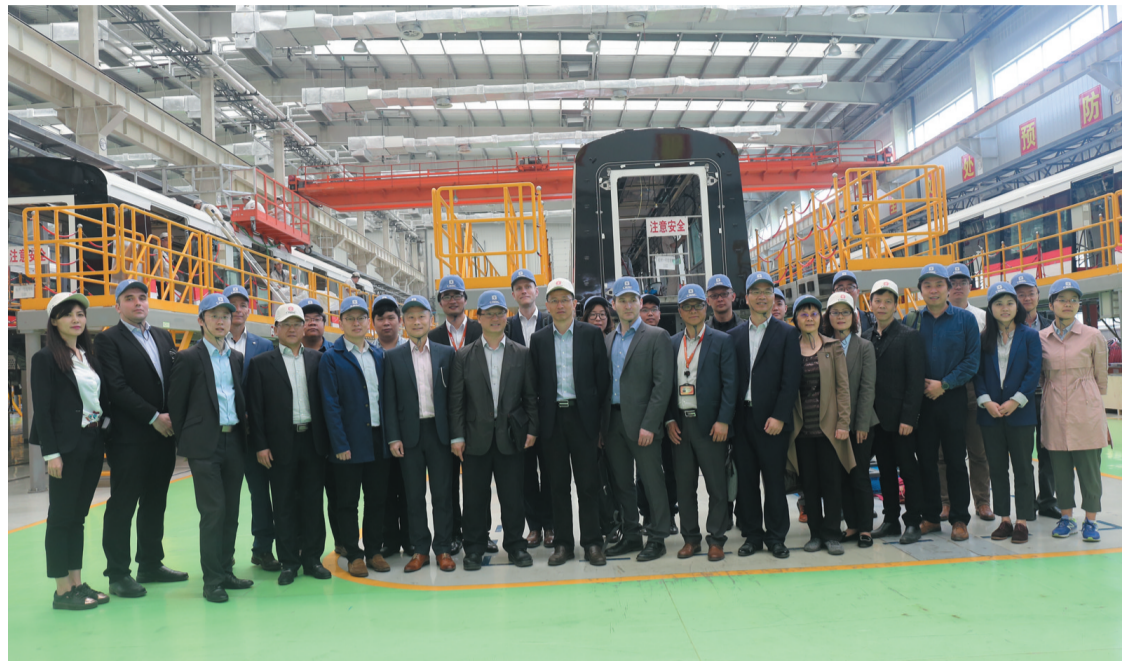
香港地铁全球技术团队来公司交流

公司整车业务牢固树立“以人为本，打造精品”的理念，服务杭州交通。自2013年9月投产以来，公司已执行杭州1号线、杭州2号线、杭州4号线、杭州5号线、杭州6号线项目。同时，为满足车辆需求，公司从2018年开始积极进行组装修布优化与节拍优