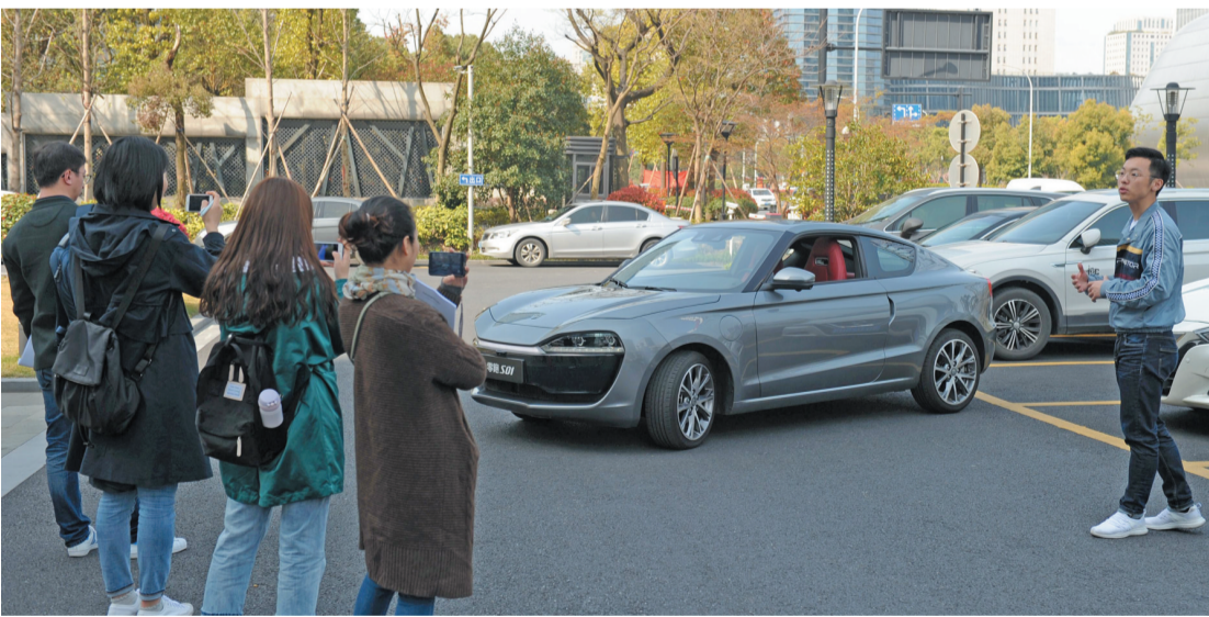
图为“零跑S01”在演示自动智能泊车

在浙江,有一款App,全省有40%的人是它的用户,这款App上集合了17个类别,300余项服务,与每个人的生活都息息相关。大名鼎鼎的“浙里办”由位于云栖小镇的数梦工场开发,推出了诊疗挂号、社保查询、公积金提取、出入境办事服务、教育生活缴费、交通违法查询等各类在线服务,省级掌上办事168项、市级平均452项、县级平均371项。