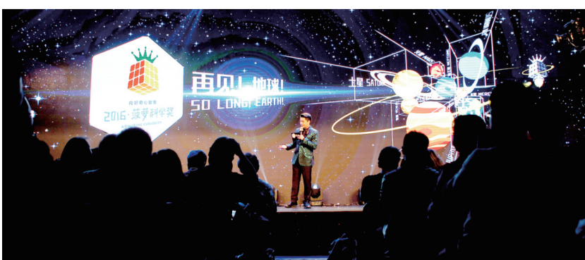
2016年薇萝科学奖颁奖现场