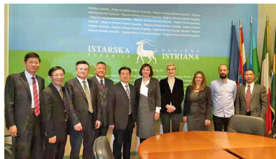
为英国观众呈现“熊猫不说的秘密”

科协作为科技社团组织，与欧美发达国家及港澳台地区的科技团体、科技组织保持着密切联系。60年来，浙江科协积极发挥国际民间科技交流主代表的作用，不断扩大对外科技交流与合作，发挥民间科技团体的作用，组织开展对外科技交流、境外培训、留学服务等。服务国家外交大局，进一步建立健全与港澳台科技团体、海外留学人员和华裔科学家的联系网络，成为对外科技交流、吸引海外智力的重要渠道和平台。