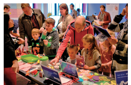
浙江省科技馆科学表演“纸的故事”参加英国曼彻斯特科技节