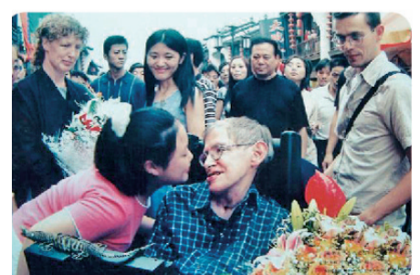
2002年8月15日著名物理学家史蒂芬·霍金的浙江之行