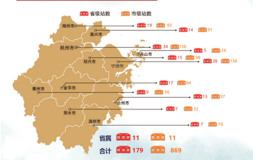
院士专家工作站分布图（2018年11月）

这一年，是全面贯彻党的十九大精神的开局之年，全国人民正紧密地团结在以习近平同志为核心的党中央周围，豪情满怀地奋进在中国特色社会主义新时代的伟大征程上。