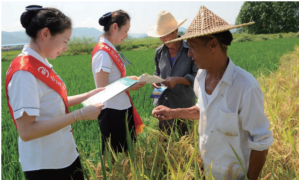
农行“三农”服务队深入农村宣传普惠金融知识

据了解,为解决农村金融服务“最后一公里”,农行浙江省分行大规模实施“惠农通”工程,在全省农村铺设了15900多台惠农通机具,打造了一条连通城乡的金融信息高速公路,把“银行”开到了村门口,实现了惠农服务“村村通”。