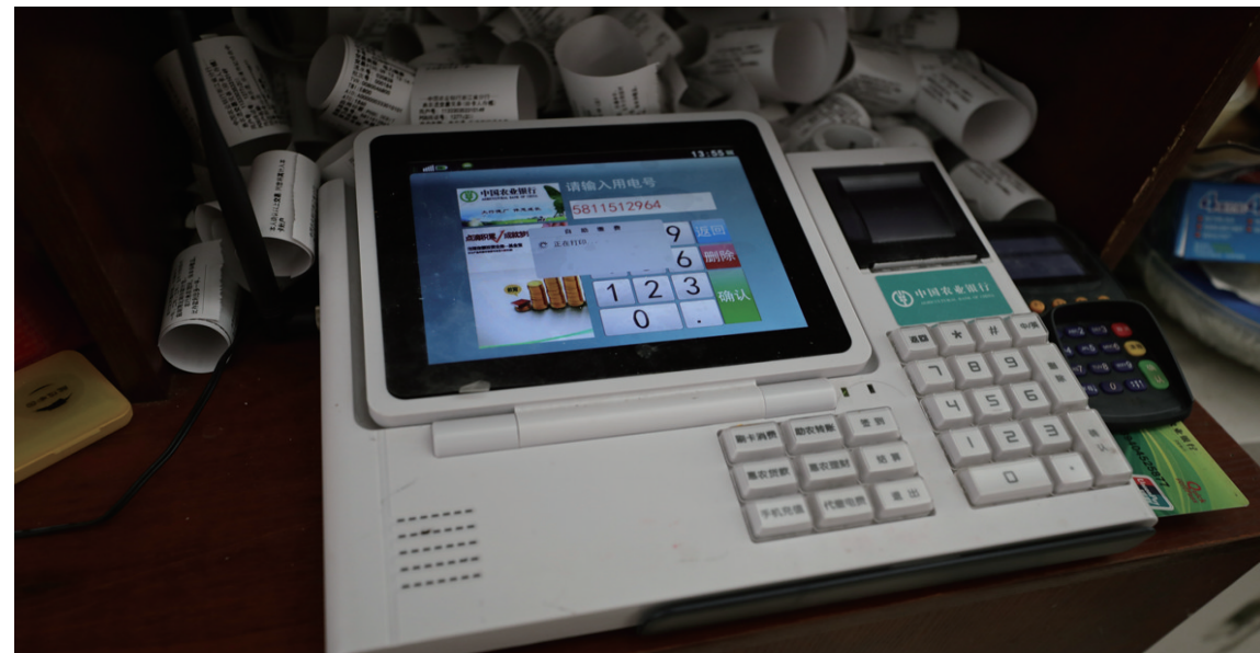
农行金穗惠农通机具,全省已铺设15900多台