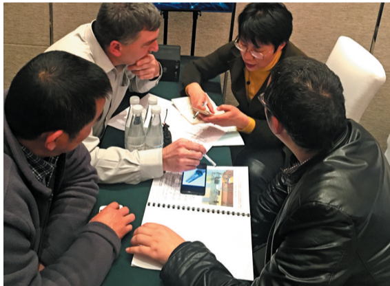
乌克兰国家科学院亚历山大·塞可密瑞尔博士带来的动力电池管理系统可实现12分钟充电80%。图为他正在与企业对接洽谈。