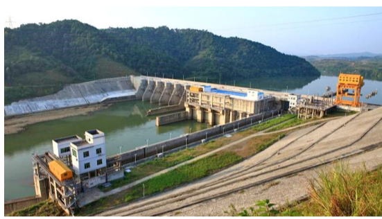
电站名称:广西金鸡滩水电站 机组容量:3×24MW 水轮机型式:灯泡贯流式

公司拥有各类专业技术人员 100 多人,其中水机和电机专业教授级高工 5 人,外国专家 1 人,高级工程师 15 人。研发设计、项目管理、生产管理、质量管理等团队的业务骨干主要来自原富春江富士电机有