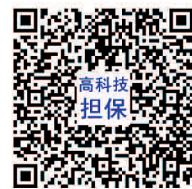
详情手机扫描二维码

联系电话: 0571-87020963, 81396317 13777404242, 18658868796