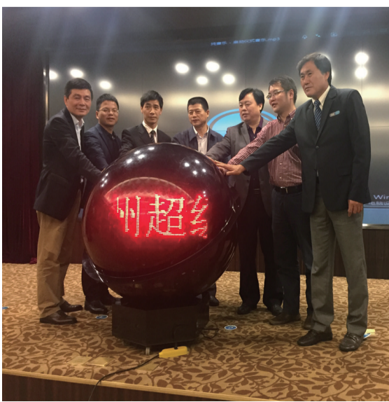
现场嘉宾启动比赛水晶球