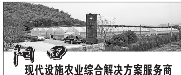
现代设施农业综合解决方案服务商