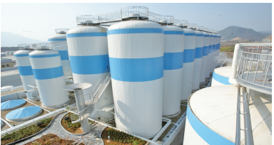
千岛湖啤酒厂一景

从原先一个淳安的本土小啤酒厂成长为全国销量前十的知名企业,千岛湖啤酒凭借着差异化的个性之路,