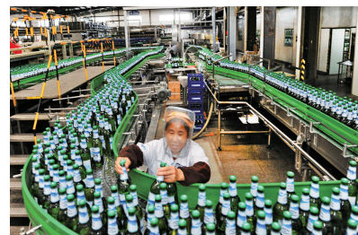
微机控制的生产线

当啤酒遇上温泉,会擦出什么样的火花?郑名传透露,总投资7亿元的千岛湖啤酒小镇项目预计于今年8月投入运营。“小镇里的啤酒温泉采用一人一桶,游客可以边泡温泉边喝啤酒,泡完后躺在特别定制的燕麦草床上休息。”郑名传说,啤酒温泉是一种非常健康的休闲方式,不仅能提高心肺功能,加强血液循环,还有利于皮肤细胞的再生,让人体皮肤细腻有光泽。