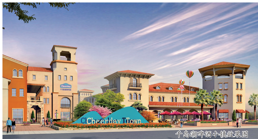
千岛湖啤酒小镇效果图