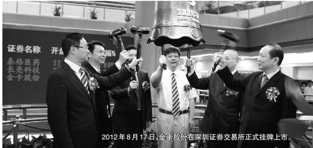
2012年8月17日,金卡股份在深圳证券交易所正式挂牌上市。

据介绍,目前温州共建立7批共113家上市企业后备资源库,今年将扩容到200家左右,这批后备资源库将成为“温州板块”的主力军,其中就有此前不愿意接触资本市场的企业。